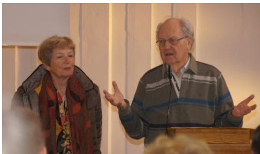
Gäste aus Utrecht grüßten uns von der Remonstranten-Gemeinde

Die Kirchengemeinde hat einen ausgeglichenen Haushalt . Von den jährlich 70.000 € für die Gemeindearbeit werden u.a. anteilig Stellen in der Kirchenmusik und Gemeindepädagogik finanziert. 2017 wurde ein Überschuss in Höhe von 7.900 € erzielt. Für die Kirchensanierung gibt es einen separaten „Bau- und Investitionshaushalt“. Die meisten Handwerkerrechnungen sind inzwischen beglichen, es bleibt noch eine Finanzierungslücke von 9.000 €.