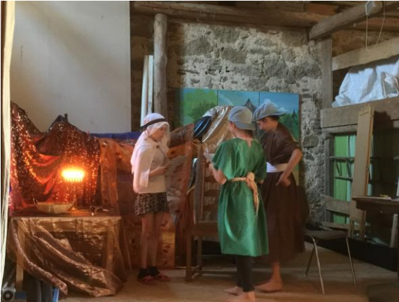
Die Kinder spielen die Samuel-Geschichte

Essen, essen, essen lautete der Tagesplan ... äh nicht ganz. Auch wenn wir alle sicherlich gern den ganzen Tag vor Conny's leckerem Essen verbracht hätten, haben wir auch die Kaninchen und Ziegen gestreichelt, viele lustige Spiele gespielt, gesungen, geschauspielert und viel über Samuel gelernt. Besonders viel Spaß hatten wir bei der Wasserschlacht, der Nachtwanderung, beim „capture the flag“-Spiel,